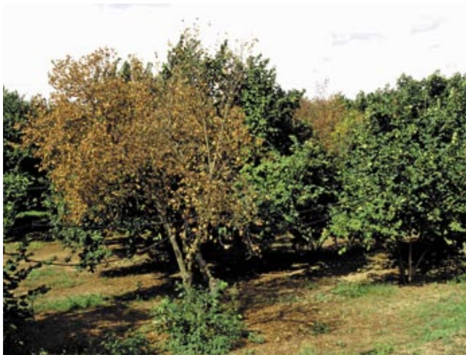
Foto 1 - Classico avvizzimento causato in piena estate da Pseudomonas avellanae su nocciolo nei Colli Cimini (VT)

Interessante anche il comportamento della Tonda Gentile delle Langhe e di Jeans, colpite in misura non superiore al 10%. Tutte le altre cultivar, comprese Tonda Gentile Romana e Nocchione, mostravano sintomi di moria su gran parte della chioma. Le analisi effettuate in laboratorio hanno confermato la presenza di P. avellanae nel campo-collezione.